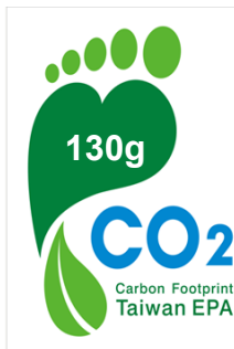
附圖一 產品碳足跡標籤標示範例

本產品碳足跡依據「包裝水產品類別規則」、公用排放係數、ISO 14067:2018及使用30%一級活動數據、70%二級數據計算結果為130g，生命週期各階段碳足跡比率如下圖所示：